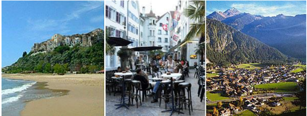
Chur verbindet in freundschaftlicher Art und Weise Städte u.a. Terracina in Italien (l.) und Mayrhofen in Österreich (r.).

Partnerschaften zwischen europäischen Städten und Gemeinden, so genannte „Jumelages“, wurden vor über 50 Jahren auf europäischer Ebene ins Leben gerufen. Die ursprüngliche Idee war es, nach dem Zweiten Weltkrieg durch Annäherung auf kommunaler Ebene zur Versöhnung in Europa beizutragen. Hinzu kommt, dass der Blick über die eigenen Stadtgrenzen die Augen für Probleme und Sorgen der Partner öffnet und auch den eigenen Horizont erweitert. Seit den Anfängen der Partnerschaftsidee ist Chur mit Bad Homburg (D), Cabourg (F), Mondorf-les-Bains (L), Mayrhofen (A) und Terracina (I) freundschaftlich verbunden. Die Partnerschaft wird gepflegt durch jährliche Bürgermeistertreffen, welche alternierend in den beteiligten Städten stattfinden. Alle zwei Jahre werden zudem mehrtägige Partnerschaftstreffen durchgeführt. Zur Churer Jumelage gibt es eine spezielle Website: www.partnerschaftsring.eu .