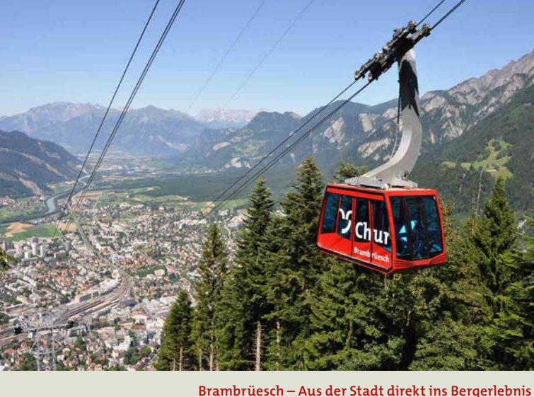
Brambrüesch - Aus der Stadt direkt ins Bergeleben