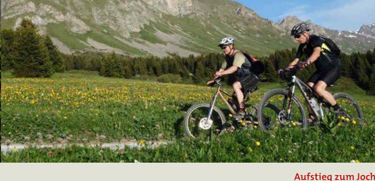
Aufstieg zum Joch