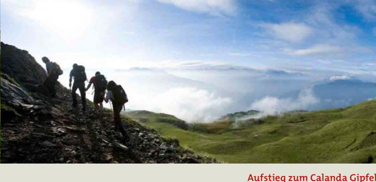
Aufstieg zum Calanda Gipfel